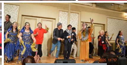
長野県&愛知県のアトラクション