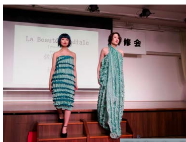
TM あいち Seminar&Show