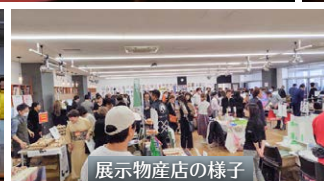
展示物産店の様子